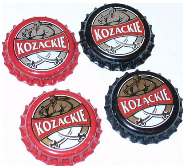
próby (MAM pierwszą)

37/2 – sygnatura złota (Rattus, Katalog) BRAK